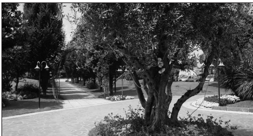
L'ingresso al Green Park curato nei minimi particolari.

Musica - ballo - gastronomia per una serata in compagnia