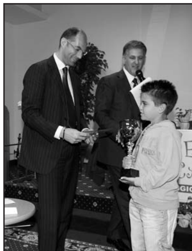
Un momento della premiazione.

Da parte mia, ogni anno provo una grandissima soddisfazione nel constatare quanto sono sempre più alti l'interesse e la voglia di apprendimento di questi ragazzi, anche per una materia non proprio consona in relazione al loro livello scolastico, tenendo anche