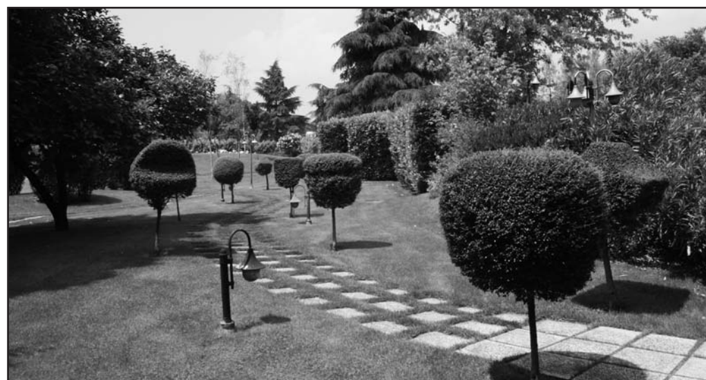
L'inizio del parco ampliato ed arricchito con una nuova fontana.