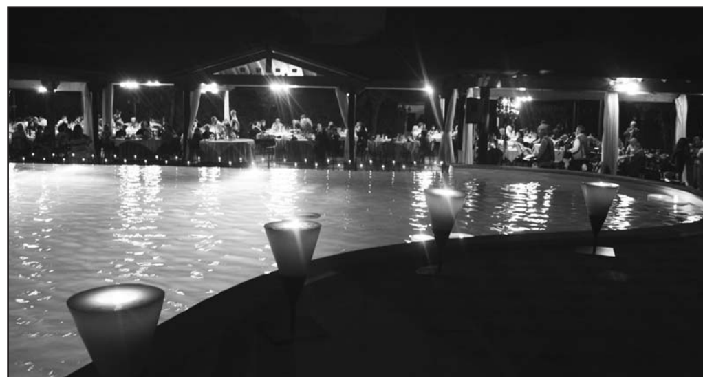
Effetti speciali a bordo piscina nella zona chalet.