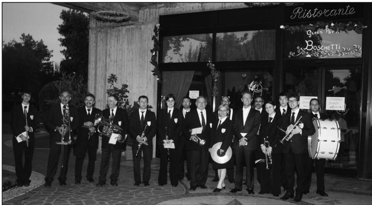
La Banda all'ingresso del Ristorante Green Park Boschetti.