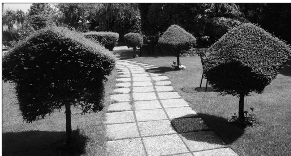
L'ingresso allo chalet dove si cena e si balla.