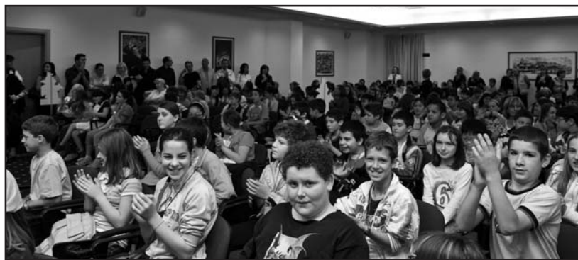
Il salone del GardaHotel gremito di studenti.

Con grande emozione e con una esplosione di gioia da parte