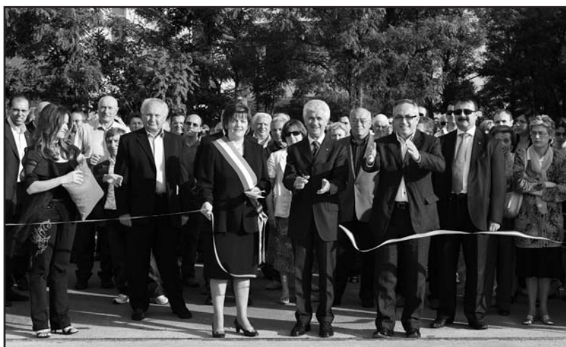
Il taglio del nastro all'inaugurazione dell'azienda Calubini di Montichiari a Grumello Cremonese.

dente della provincia di Cremona, ma "le istituzioni sono al vostro fianco, signori Calubini" hanno assicurato l'assessore regionale e il sindaco.